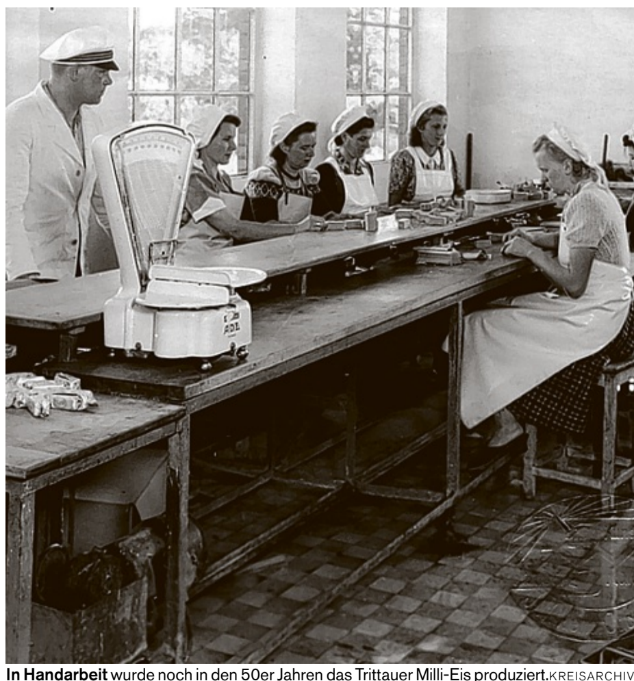
In Handarbeit wurde noch in den 50er Jahren das Trittau-Milli-Eis produziert.