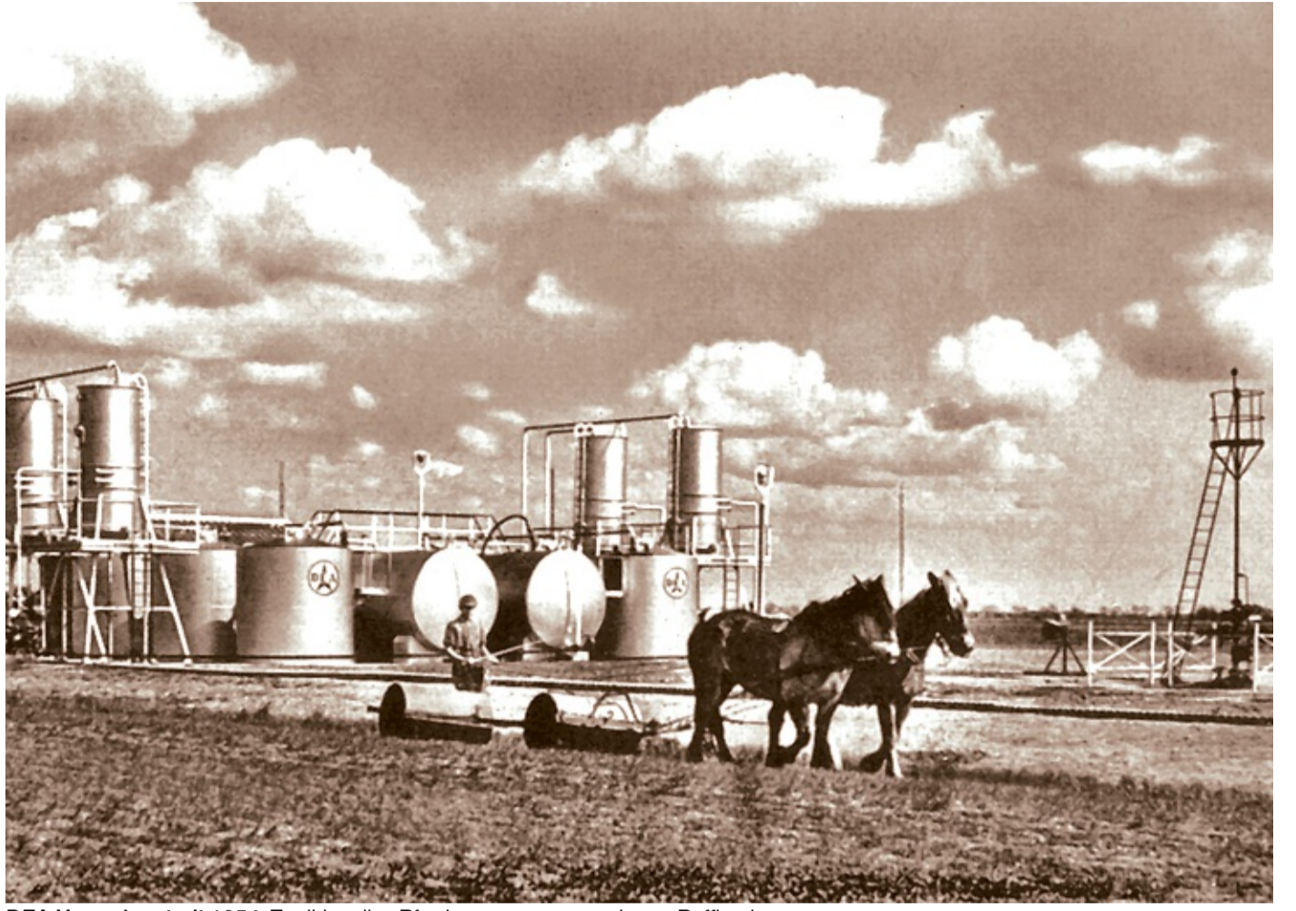
DEA Hemmingstedt 1954: Traditionelles Pferdegespann vor moderner Raffinerie.

Wieder stellen sich Fragen nach der politischen Begleitung. Auch geht es um die